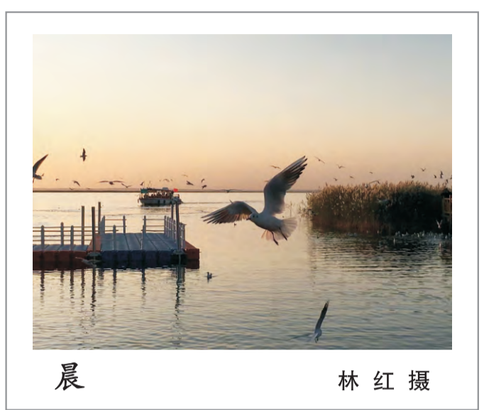
晨 林红 摄

风雪即将过去，病魔终将溃散，待到花开燕来时，让我们走出来，看乾坤依旧，山河不改，在我们共同捍卫的土地上，互道一声：岁月静好、别来无恙！ (张 杨)